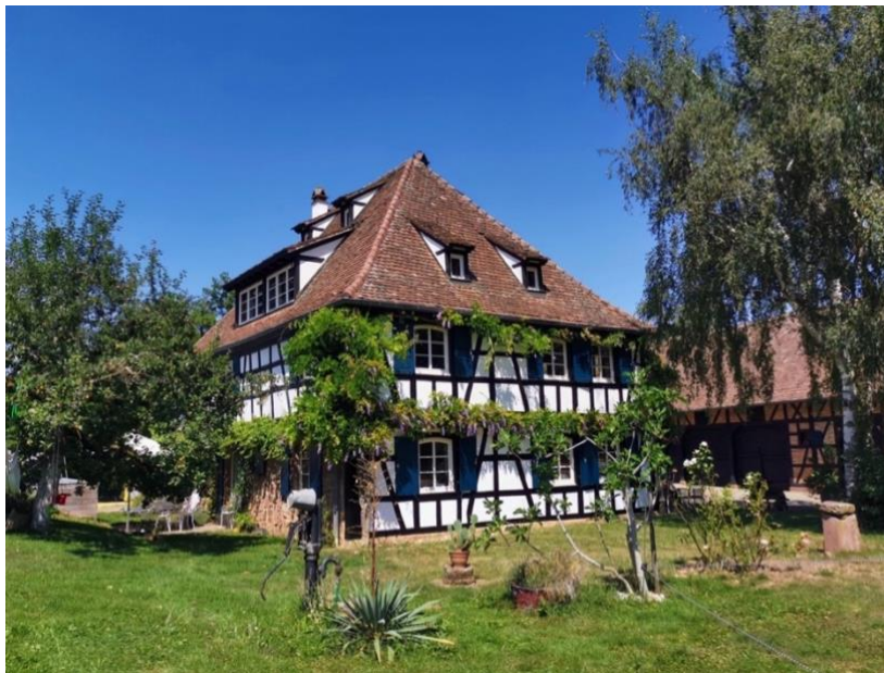
Moulin de Berstett

Les maisons alsaciennes sont l'identité de notre région et l'héritage de notre passé. Éco-conçues, durables et adaptables, elles doivent faire partie de notre futur. Ensemble préservons-les !