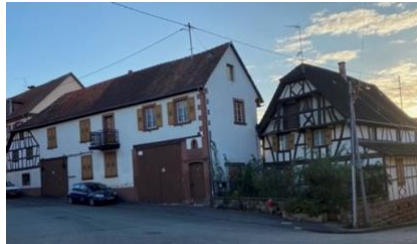
Le corps de ferme en 1914

Le projet de la commune d'Uhlwiller d'un équipement public polyvalent (micro-crèche, maison de santé et salle d'activité scolaire) devait voir le jour après la démolition totale d'un ancien corps de ferme du XVIIIe siècle situé au cœur de la commune.