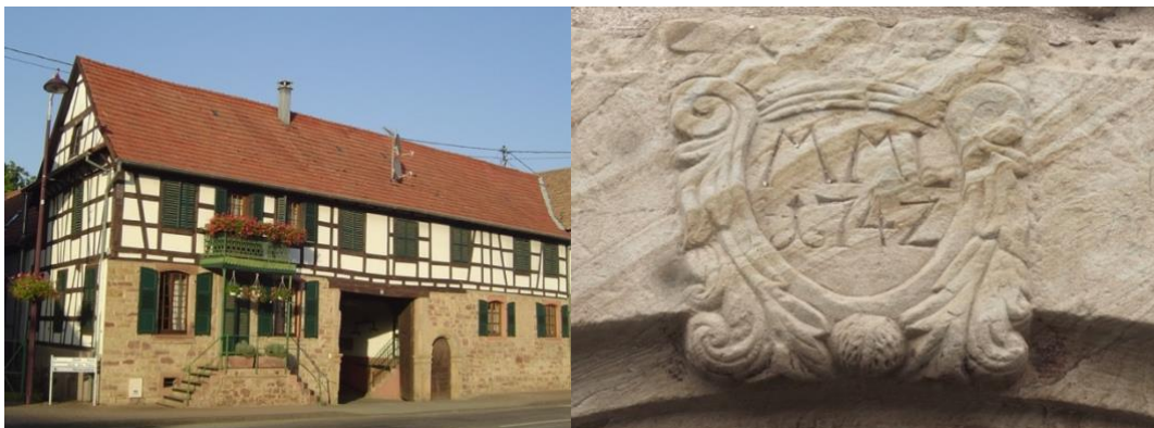
Ferme 's Bierels à Quatzenheim - XVIIIe et XIXe siècle © Denis Elbel Clé de voûte du portillon - 1742 - © D.Elbel