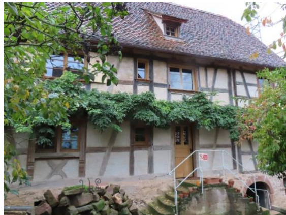
Octobre 2023