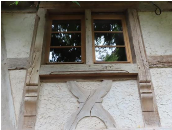
2023