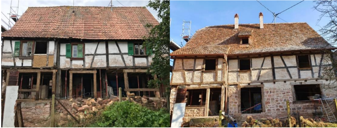
Arrière, travaux en 2020